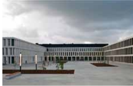
ziekenhuis AZ Groeninge, Kortrijk