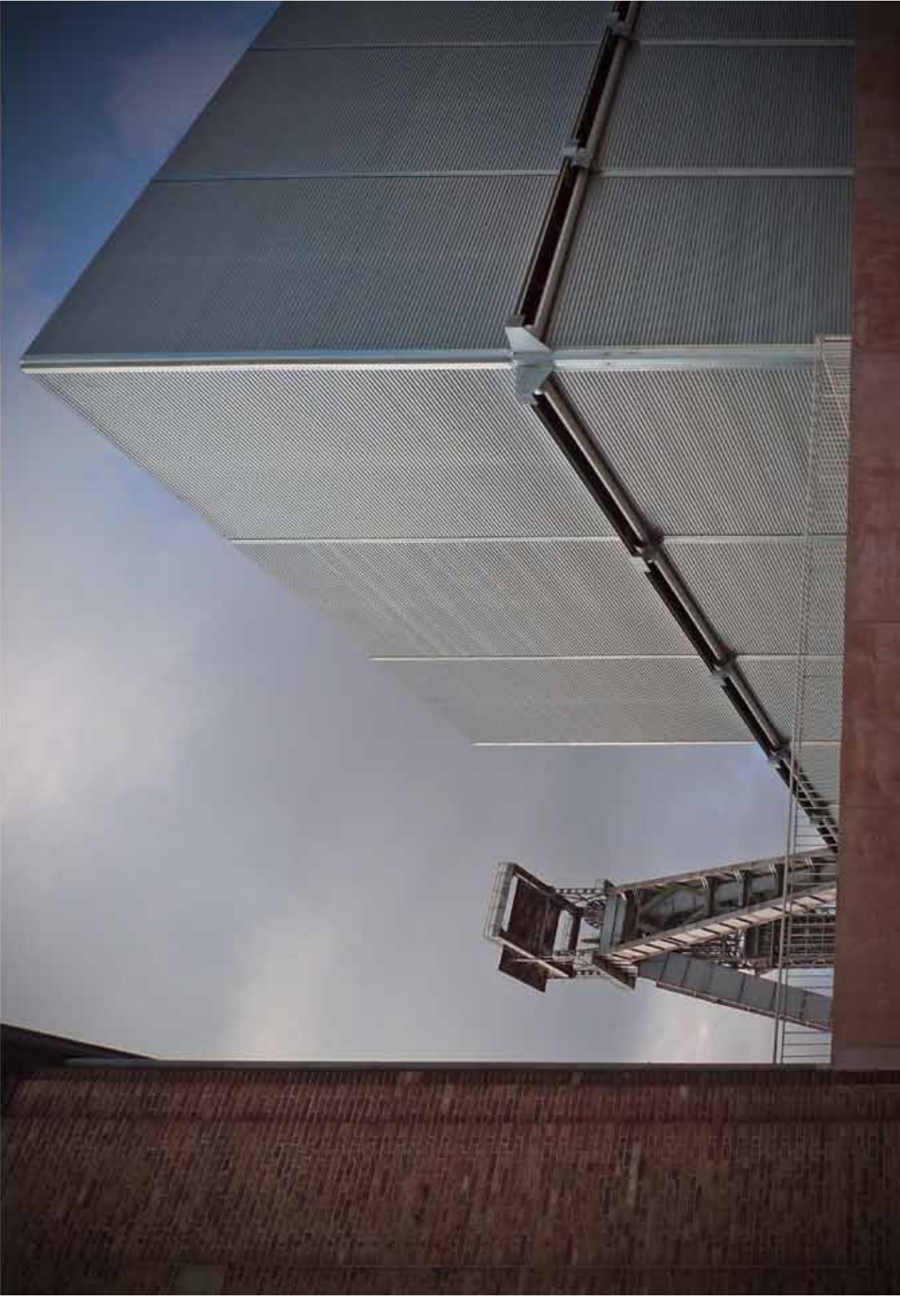
cultuurcentrum C-Mine, Genk — 51N4E

In 2010 was er voor het eerst een structurele samenwerking tussen Architectuurwijzer en de stad Genk . Genk is nog een jonge stad zonder echt centrum maar met verschillende wijken. De afgelopen jaren zijn heel wat belangrijke voorzieningen zoals straten, pleinen en publieke gebouwen gerealiseerd en wordt er nog volop verder gewerkt. Architectuurwijzer en de stad Genk organiseerden rond het thema van nieuwe architectuur en stedenbouw in Genk een lezingenreeks: Genk in Stelling .