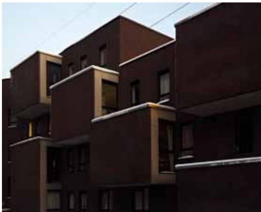
sociale woningbouw Arno Roncada — Lava

Genk wil het verschil maken met sociale woningbouw. Wim Goossens van Lava architecten lichtte alvast een tipje van de sluier op met een project van 32 woningen. De eenvoudige vaststelling dat de context gratis is (en dat wil wat zeggen in een sector als sociale woningbouw die zo onderhevig is aan de logica van het budget) leidt ertoe dat Lava inzet op het betrekken van het nieuwe gebouw op de kwaliteiten uit de omgeving. Op pragmatische wijze verwelkomt het architectenbureau de buitenruimte (visueel) in de nieuwe interieurs, waardoor die aan ruimtelijkheid winnen. Lava bewijst verder dat het creatief omspringt met (standaard) detaillering, met (eveneens gratis) licht en volumes. Kortom, Lava haalt alles wat het kan uit de beperkte budgetten en de beperkende regels van de sociale woningbouw.