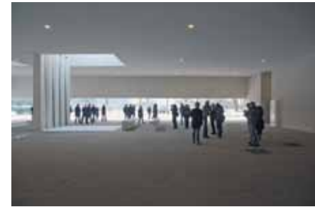
crematorium Heimolen, Sint-Niklaas

Op 3 december 2010 vond de tweede architectuurreis richting het westen plaats. De architectuurreis bracht de deelnemers deze keer langs: het Crematorium Heimolen (Claus en Kaan), Sportcentrum De Boerekreek (Coussée & Goris architecten), Villa Yoka (OFFICE KGDVS & bureau Goddeeris), ziekenhuis AZ Groeninge (Baumschlager Eberle & Osar) en het stadskantoor van Menen (noA architecten).