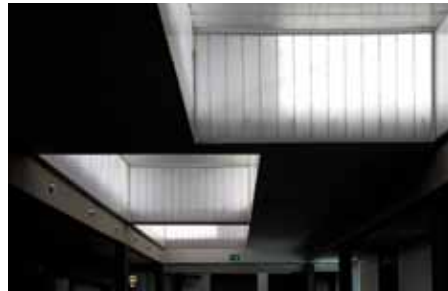
Kortrijk xpo, Kortrijk