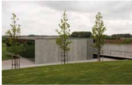
sanitairblok bij Tyne Cot Cemetery, Passendale

In het ontwerp van het sanitair blok werden een aantal fysische assen gecreëerd die de geografische eigenheid van de site volgen. Het gebouw kan gezien worden als een reflectie van de cultuur-historische eigenheid van respectievelijk de begraafplaats, de directe omgeving, het slagveld in de vallei, de nabijheid van Passendale en de stad Ieper. De hoogtelijnen van de grashelling waarop het paviljoen ge-positioneerd is liggen parallel met de as van de historische landschappelijke merktekens: de aslijn torenspits kerk Passendale, de hoofdingang Tyne Cot en de slagveldsite richting Ieper. De hoogtelijn die samenvalt met deze as vormt de meetkundige lijn waarbij het paviljoen vanuit de grond gaat zweven over de grashelling.