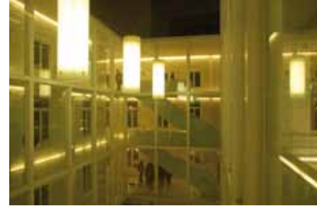
stadhuis, Menen

Het Vlaams netwerk van ondernemingen Voka in West-Vlaanderen nam in 2008 zijn intrek in 'Villa Voka' in Kortrijk. Een architecturale parel waarin alle regionale afdelingen zijn samengebracht. Lucht, licht en groen faciliteren optimaal het huiselijke kantoorleven. Het slanke en ranke gebouw is een voorbeeld van sierlijke toepassing van beton, aluminium en glas. Dit zijn materialen die het gebouw transparant maken en tegelijkertijd een heldere constructieve logica etaleren. Aan de buitenkant schiet de blik door het gebouw dat aan de zuidkant slim gefilterd is door stalen roosters. Ze omkleden het gebouw als fijne tule. Fragiliteit en transparantie gaan hier hand in hand.