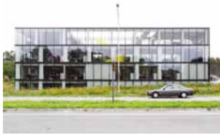
Villa Voka, Kortrijk