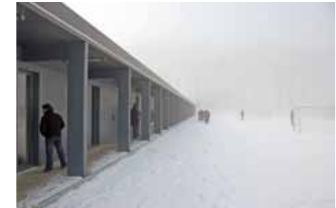
sportcentrum De Boerekreek, Sint-Laureins

CLAUS EN KAAAN CREMATORIUM HEIMOLEN SINT NIKLAAS 2006-2008