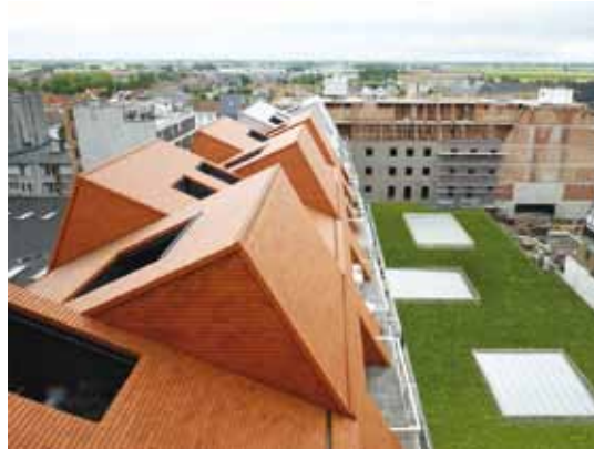
residentie De Boei, Middelkerke