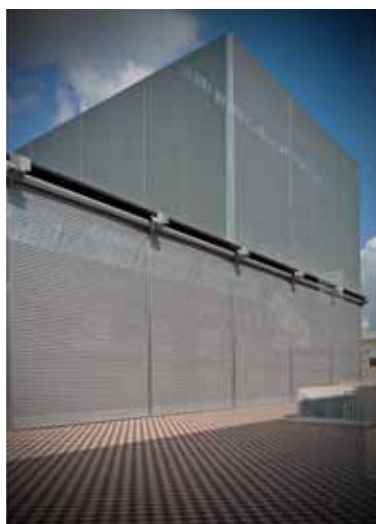
cultuurcentrum C-Mine, Genk — 51N4E

In het C-Mine cultuurcentrum tref je geen harde contrasten aan tussen oud en nieuw. Al het waardevolle oude is zonder meer behouden en door middel van de voortzetting van de bestaande conceptueel-ruimtelijke logica geherwaardeerd. De door 51N4E aangebrachte 'schade' aan het oorspronkelijke energiegebouw is er enkel om het concept (de ruimtelijke herhaling van de geschiedenis zonder daarvoor in de anekdotische figuratie te vervallen) te versterken. Daardoor krijg je nooit het gevoel dat de oude gevels en machines louter decor zijn. Het nieuwe is bovendien nergens onderdanig aan het oude. Peter Swinnen benadrukt dat de ruimte primeert.