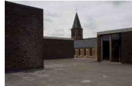
ontmoetingscentrum Jonkershove, Houthulst