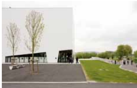
gemeenschapscentrum, Avelgem

Op 7 mei 2010 vond de eerste architectuurreis plaats richting het westen. De architectuurreis bracht de deelnemers langs: het Gemeenschapscentrum in Avelgem (Dierendonckblancke), Kortrijk xpo (Office KGDVS), ontmoetingscentrum Jonkers-hove (Rapp+Rapp) en de onthaalpaviljoenen begraafplaatsen Langemark-Poelkapelle en Passendale (Govaert en Vanhoutte).