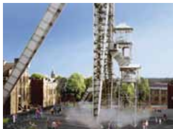
C-Mineplein — Hosper architecten

Op de tweede editie van 'Genk in Stelling' stonden drie voorlopige resultaten van de Open Oproep centraal. De Open Oproep is een selectieprocedure die gebaseerd is op het principe van een architectuurwedstrijd. De Open Oproep omvat een selectie en voordracht van ontwerpers en ontwerpteams voor diverse opdrachten op het vlak van bouwkunde, stedenbouw en landschapsarchitectuur in Vlaanderen. Op de tweede editie van 'Genk in Stelling' stelden architectenbureaus BUUR (B), Hosper (NL) en HUB (B) elk een kersvers landschaps- en/of stedenbouwkundig project voor. Elk van de voorgestelde projecten is in ontwikkeling in groot-Genk.