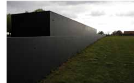
onthaalpaviljoen begraafplaats Langemark-Poelkapelle