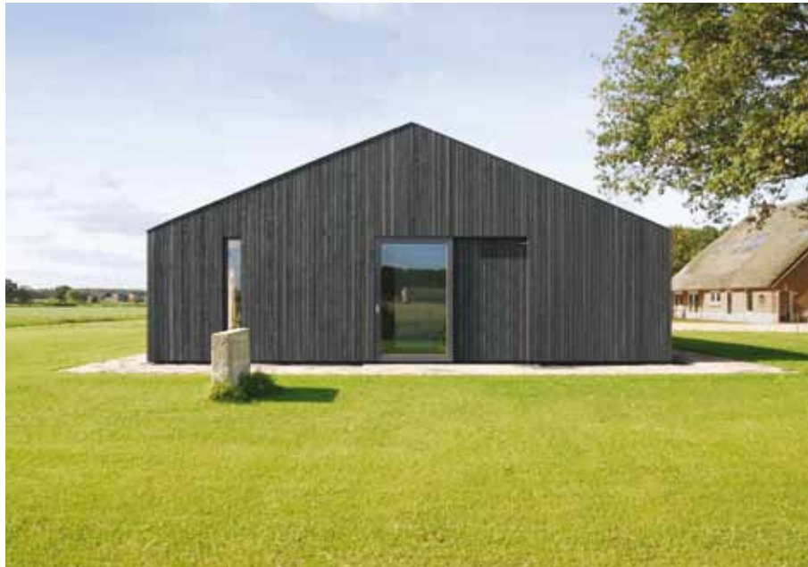
gemeenschappelijk woonerf met drie woningen, Overmeen / Heeten

Happel Cornelisse is een jong en breed georiënteerd architectenbureau uit Nederland. Ninke Happel en Floris Cornelisse studeerden in 2003 af aan de TU Delft en deden ervaring op bij Franz Ziegler en Jo Coenen . Nadien richtten ze samen het architectenbureau Happel Cornelisse op. Happels interesse voor kunstcritiek en omgevingspsychologie drukt een duidelijke stempel op de diverse projecten binnen het bureau. Via deelname aan talloze wedstrijden probeert het bureau steeds de eigen grenzen te verleggen.