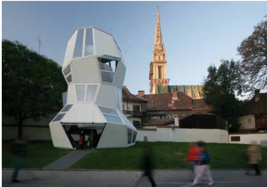
108 ZG Pavilion 09, Zagreb