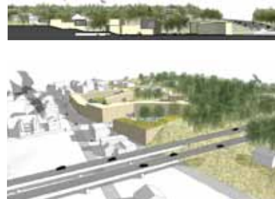
Grotestraat Zuid-Oost — De Gouden Lijn

Frank Vanden Ecker van De Gouden Lijn sprak over het ruimtelijk uitvoeringsplan Grotestraat Zuid-Oost , een 'onmogelijke' hellende site naast een viaduct. Publieke ruimte is het centrale begrip in dat plan. Nieuwe bebouwing keert zich af van de drukke Westerring, richt zich naar het nieuwe publieke plein en vormt zo een buffer tussen weg en plein. Het aanwezige bos hoeft niet te wijken, maar maakt integraal expliciet deel uit van de nieuwe ontwikkeling.