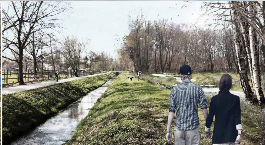
Nieuwe parallelle loop © Tractebel i.s.m ADR architectes/Georges Descombes en IMDC