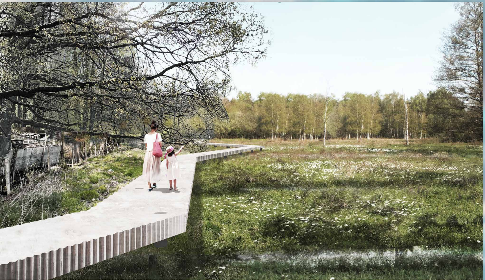
Vlonderpad in Elzenhout

© Tractebel i.s.m ADR architectes/Georges Descombes en IMDC