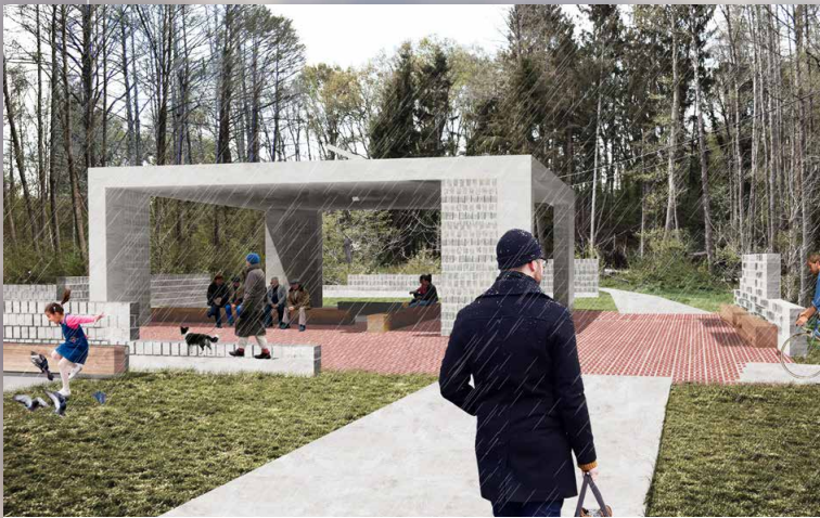
Schuilplaats ter hoogte van Paresbemdstraat © Tractebel i.s.m ADR architectes/Georges Descombes en IMDC