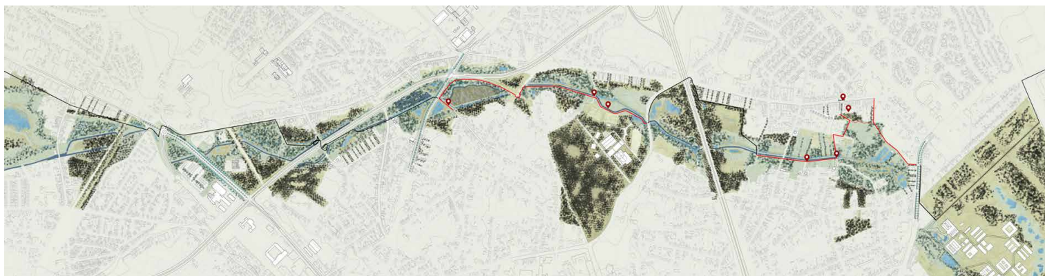
Het masterplan voor het herstel van de meer dan 7 kilometer lange Stiemervallei, de waterrijke levensader van de stad. © Tractebel i.s.m ADR architectes/Georges Descombes en IMDC

work-activiteiten in de wilde natuur. Het uiteindelijke doel van al die initiatieven is niet zozeer om te komen tot een 'gedragen' project, maar wel om de stedelingen dicht bij de natuur te brengen en hen bewust te maken van de cruciale rol van water en natuur voor klimaatadaptatie en welvaart.